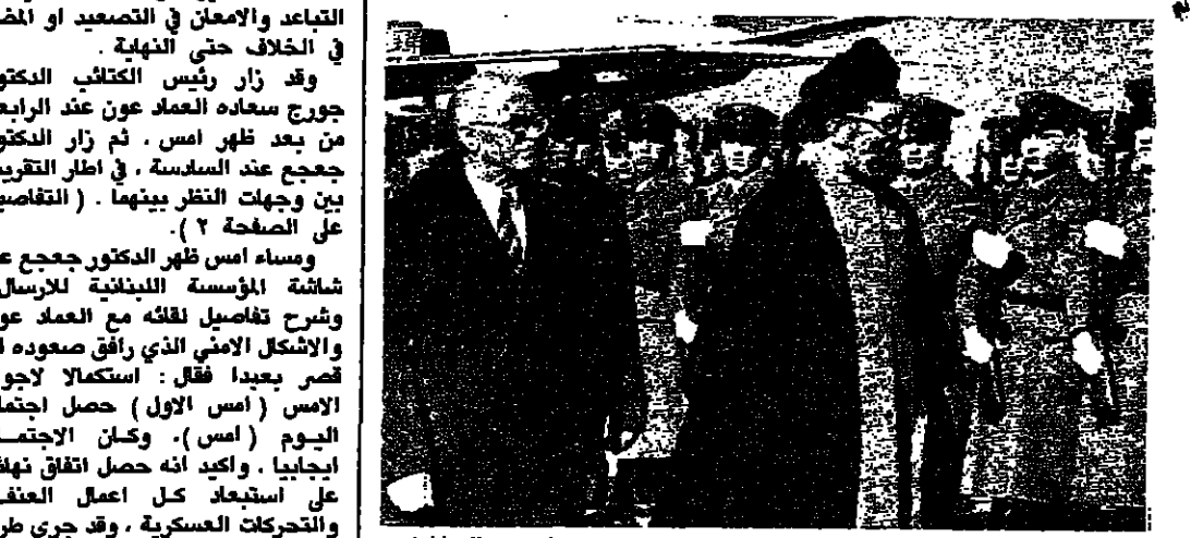
خامنيي يستعرض مع الرئيس اليوغوسلافي حرس الشرف لدى وصوله الى مطار بلغراد

وصل الرئيس الإيراني حجة الاسلام علي خامنئي امس الاثنين الى بلغراد في زيارة رسمية الى يوغوسلافيا للتحية الاولى في جولة اوروبية ستقوده ايضا الى بوخارست. يذكر ان هذه الزيارة هي الاولى يقوم بها رئيس الجمهورية الاسلامية الى أوروبا. وتتصافى في وقت تجتذب فيه العلاقات بين ايران واوروبا الغربية مرحلة دقيقة. ويعلم ان دول المجموعة الاقتصادية الاوروبية قربت استعدادها سلفا في طيران ووقف الزيارة على مستوى عال الصداقة الامم المتحدة ضد الكاتبة البريطانية سلمان رشدي مؤلف «الآيات الشيطانية». (راجع الصفحة ١٢)